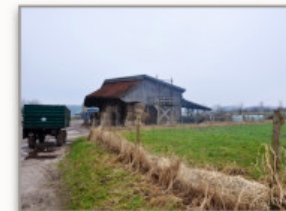
Bei jedem Wetter im Freien

Durch die tägliche Arbeit mit den unterschiedlichen Tierarten wie Bienen, Ziegen, Schafen, Hühnern und Kühen, die durch die Gemeinschaft und ihrer Art entsprechend gefüttert, versorgt und genutzt werden, gewinnen die Kinder und Jugendlichen tiefe Einblicke in die Vorgänge der Natur und die Aufgabe des Menschen in dem Zusammenhang der bäuerlichen Landwirtschaft.