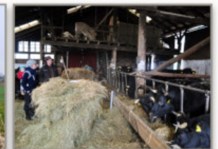
Und im warmen Kuhstall